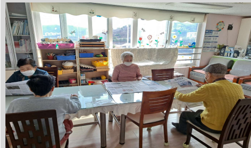
회상활동 // 세상뉴스전하기, 신문보기